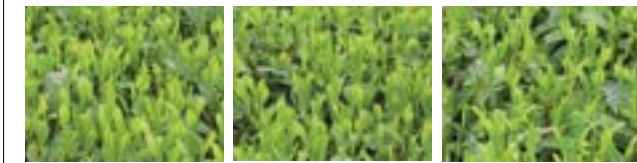
図1 4月27日(被害1か月後)の新芽

新茶の時期が近づき、生産者の皆様は毎年のことながら期待と不安で胸躍る日々をお過ごしのことと推察いたします。さて今年も全国的な冷え込みで、3月以降の気温次第では新茶が昨年より遅れることも予想されますが、茶樹は休養充分で良質な味の良いお茶が摘採できるものと思えます。ところで、八女茶の製造の割合のなかで「玉露」「冠茶」「煎茶」と3分類したときに「冠茶」の比率が多すぎると感じます。確かに八女茶という標準からすれば「冠茶」が無難かなとは思いますが、本質的な部分では「八女茶」＝「甘い玉露」という「まい煎茶」でゆくべきではないかと思えます。それも単価を無視した茶づくりではなく、厳しい消費者に合った適正な価格でいかにおいしい八女茶を提供できるかの努力が必要と考えます。特に、今年話題の「深蒸し茶」がキーポイントになりそうなので八女茶は揉み崩していない茶をお願いしたいと存じます。生産者皆様の健闘をお祈りいたします。